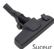
Suceur sols mixte ECO